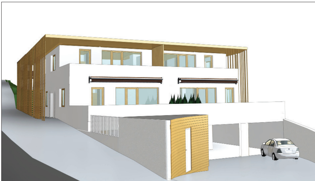
Die Erschließung des Hauses erfolgt von der Nordseite. Terrassen sind im Süden und Westen angeordnet.